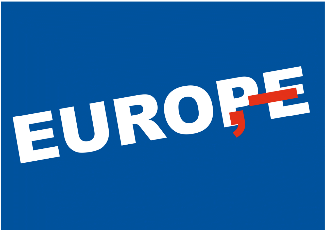
Europe, 2011, Digitaldruck, 70 × 100 cm Abbildung: Lex Drewinski«

»Im Plakat zu reduzieren ist immer möglich. Mit dem Hinzufügen hingegen wäre ich zurückhaltend, denn ein Plakat ist kein Sparbuch.«