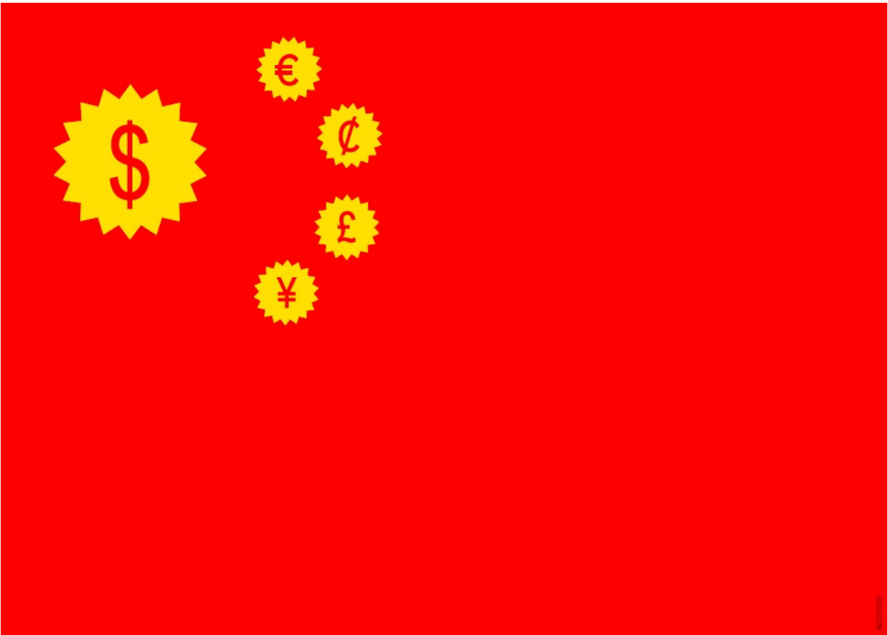
Current Flag of China, 2013, Digitaldruck, 70 × 100 cm Abbildung: Lex Drewinski