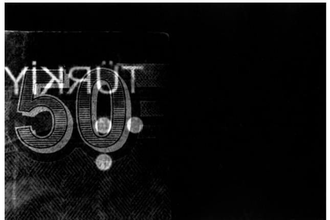
Fatma Aliye, Tafeln, Detailansichten