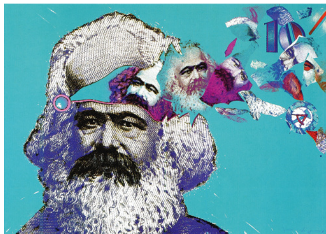
WP Eberhard Eggers, Adieu Karl Marx, 1989/90 Farblithografie auf Bütten, 100 x 140 cm Sammlung Haupt

In der Ausstellung CASH on the Wall sind Gemälde, Objekte, Skulpturen, Druckgrafiken, Collagen, Fotografien, Installationen und Videos zu sehen. Sie vermitteln einen vielschichtigen Einblick in die Thematik. Die Exponate stammen aus der Kunstsammlung der Berliner Volksbank und der Sammlung Haupt (Berlin) sowie von weiteren Leihgebern.