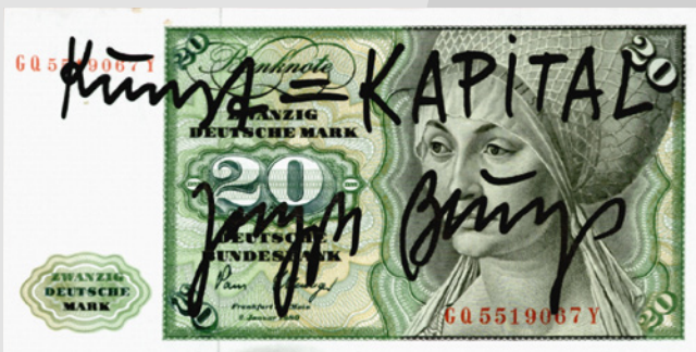
Joseph Beuys, Kunst = Kapital, 1979 Original-Banknote, von Hand beschriftet, 7 x 14 cm Sammlung Haupt