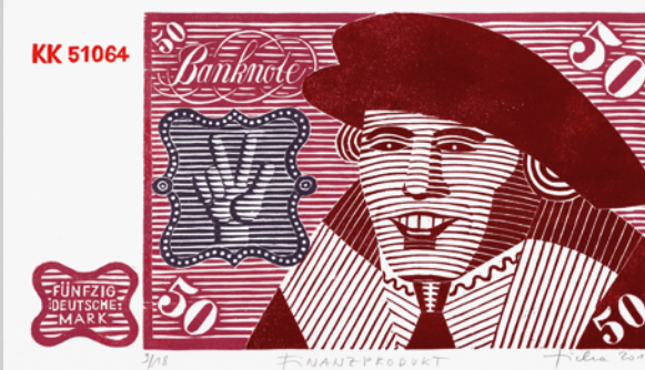
Hans Ticha, Finanzprodukt, 2010 Farbholzschnitt, 42 x 63 cm (30 x 56 cm), 9/18 Sammlung Haupt

CASH on the Wall presents paintings, objects, sculptures, prints, collages, photographs, installations and videos in an exhibition offering multifaceted perspectives on the subject. The works on display are from the Kunstsammlung der Berliner Volksbank and the Sammlung Haupt (Berlin), as well as other lenders.