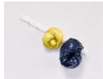
Julia Haugeneder ohne Titel (Hook) , 2021 Buchbinderleim, Pigment, Luftpolsterfolie, POM 96 x 140 x 36 cm Hau/S 21015