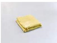
Julia Haugeneder Faltung 211 , 2020 Buchbinderleim, Pigment, Luftpolsterfolie 51 x 43 x 10 cm Hau/S 200025