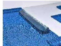
Julia Haugeneder Faltung 220 , 2020 Buchbinderleim, Pigment, Luftpolsterfolie 17 x 160 x 25 cm Hau/S 200033