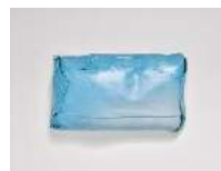
Julia Haugeneder Faltung 203 , 2020 Buchbinderleim, Pigment, Luftpolsterfolie, Kreidespray 53 x 151 x 28 cm Hau/S 200017