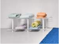
Julia Haugeneder Stack III , 2020 Plexiglas, POM, Buchbinderleim, Pigment, Luftpolsterfolie, Nylon 64 x 151 x 53 cm Hau/S 200035