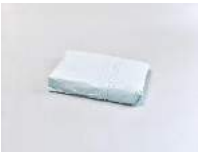
Julia Haugeneder Faltung 162 , 2018 Buchbinderleim, Pigment, Luftpolsterfolie 52 x 35 x 9 cm Hau/S 200016