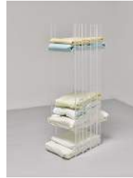
Julia Haugeneder Stack (Faltung 224-230) , 2021 Plexiglas, POM, Buchbinderleim, Pigment, Luftpolsterfolie 150 x 45 x 75 cm Hau/S 210017