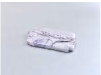
Julia Haugeneder Faltung 215 , 2020 Buchbinderleim, Pigment, Luftpolsterfolie 49 x 28 x 11 cm Hau/S 200029