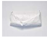
Julia Haugeneder Faltung 222 , 2021 Buchbinderleim, Putzgitter, Luftpolsterfolie, Pigment 70 x 150 x 50 cm Hau/S 21008