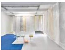
Julia Haugeneder ohne Titel (Lamellen) , 2021 Buchbinderleim, Latex, Silikon, Pigment, Marmormehl Format variabel Hau/S 21012