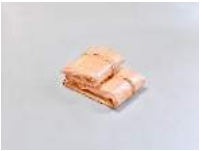
Julia Haugeneder Faltung 207 , 2020 Buchbinderleim, Pigment, Luftpolsterfolie 38 x 28 x 19 cm Hau/S 200021