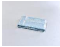
Julia Haugeneder Faltung 210 , 2020 Buchbinderleim, Pigment, Luftpolsterfolie 49 x 30 x 8 cm Hau/S 200024