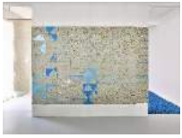
Julia Haugeneder ohne Titel (anti slip) , 2021 Linolschnitt 200 x 300 cm Hau/S 21014