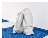
Julia Haugeneder Faltung 221 , 2021 Buchbinderleim, Pigment, POM, Baumwolle, Luftpolsterfolie 113 x 110 x 110 cm Hau/S 210001