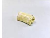
Julia Haugeneder Faltung 205 , 2020 Buchbinderleim, Pigment, Luftpolsterfolie 33 x 23 x 26 cm Hau/S 200019