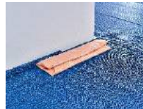
Julia Haugeneder Faltung 214 , 2020 Buchbinderleim, Pigment, Luftpolsterfolie 102 x 9 x 9 cm Hau/S 200028