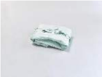
Julia Haugeneder Faltung 216 , 2020 Buchbinderleim, Pigment, Luftpolsterfolie 39 x 28 x 17 cm Hau/S 200030