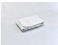
Julia Haugeneder Faltung 217 , 2020 Buchbinderleim, Pigment, Luftpolsterfolie 38 x 28 x 17 cm Hau/S 200031