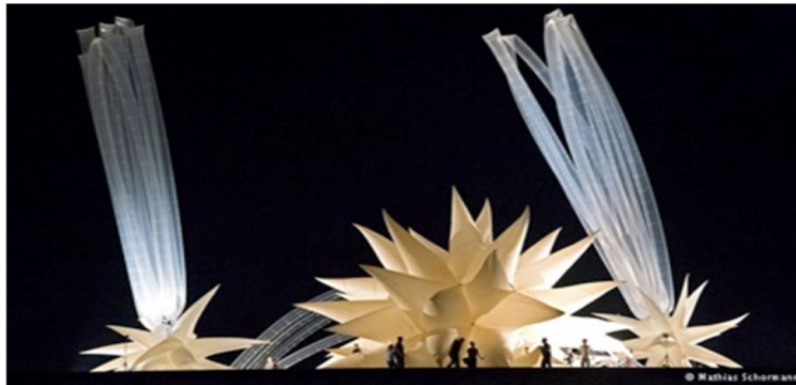
Otto Piene, Instalación "More Sky", 2014, National Galerie, Berlín.

Teherán, Rainbow Museum of Contemporary Art, febrero-mayo 2015