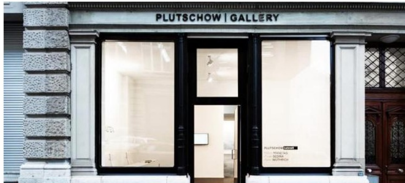
Plutschow Gallery, Zürich