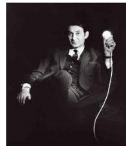
Otto Piene

El lanzamiento de este primer libro fue un interesante final a la exposición Objects de Otto Piene, inaugurada en el mes de octubre del 2014. De este modo, la Plutschow Gallery de Zúrich se unió a una fuerte deriva existente en el arte actual: el interés por el Arte Zero.