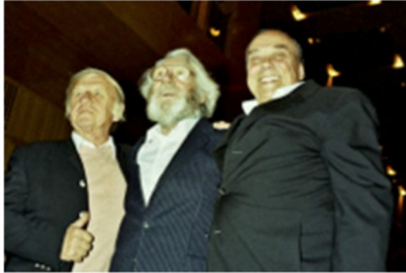
Heinz Mack, Otto Piene y Günther Uecker. Instantánea de un grupo que retrata una generación

Otto Piene es un artista de una gran importancia para el siglo XX y XXI. Fue pionero y su actitud ante la vida y el conocimiento jamás se escindió del Arte. Con el Grupo Zero fue capaz de arrastrar el arte de los medios tradicionales (Pintura, Escultura...) a los nuevos medios, materiales y tecnológicos. Son famosas sus obras de Luz en movimiento, Fuego, Humo... La unión de Naturaleza y Fenómenos es una constante en su obra; una apariencia entre escultura y pintura. La influencia de los cuadros monocromos y la relación con la posguerra que implicaba la depuración del arte figurativo, hizo que Piene se concentrase en la claridad, lucidez, pureza de los colores y en la vibración y el vaivén de la Luz. Consecuencia de su pensamiento fue una Estética nueva, una apariencia entre escultura y pintura. Objetos de luz. Desarrolló una nueva forma de Arte Optico y Cinético.