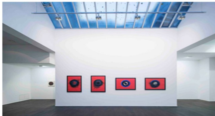
Otto Piene, Cuadría „Zwischen Düsseldorf und Köln“, 2011

Para poder apreciar el pensamiento y la intemporalidad de los fundamentos de un movimiento artístico es necesario distanciarse. Zero tiene sus fundamentos en valores sin caducidad, intemporales. Influidos por las ideas de T. von Doesburg y la experiencia de la Abstracción, llevará hacia adelante esta nueva posibilidad de expresión. Ahora las alegorías, los símbolos no son necesarios para la transmisión de conceptos, como el amor, la justicia, la pobreza... Ha nacido una nueva estética que refleja de un modo diferente las constantes antropológicas, como por ejemplo: la Rothko Chapel en Houston. El silencio envolvente hace que todo lo demás sea superfluo. Y, Otto Piene encarna esta búsqueda insaciable del arte en la vida. Este es su legado.